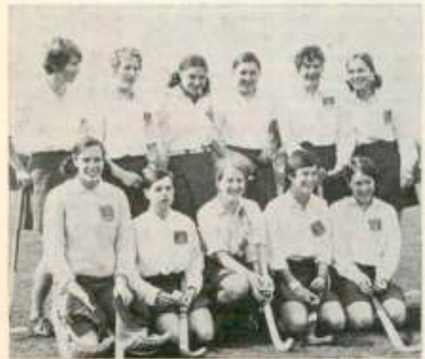
Het Nederlandse meisjes A-team, dat te Eindhoven met 4—0 van België won