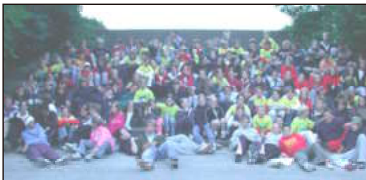
Het hele soeapie op de heuvel. Je ziet deelnemers nog jaren lopen in de speciaal gemaakt T-shirts.