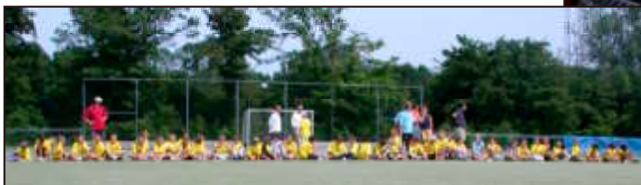
U mag raden welke kleur de T-shirt's deze keer hadden.